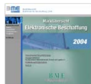
Startbildschirm der Marktübersicht Elektronische Beschaffung 2003/2004