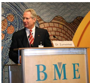
Dr. Klaus Zumwinkel Vorstandsvorsitzender Deutsche Post AG