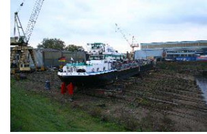
Werft an Europas größtem Binnenhafen in Duisburg

in Wiesbaden. Wurden im August 2002 noch 19,7 Mio. Tonnen Güter auf den deutschen Binnenwasserstraßen befördert, so waren es im gleichen Monat dieses Jahres nur 15,6 Mio. Tonnen. Ursache war die durch langanhaltende Trockenheit entstandenen Niedrigwasserstände der großen Wasserstraßen - insbes. der Rhein, auf den 80 Prozent der Binnenschifffahrtstransporte entfällt.